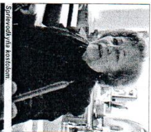
Spravená v ríni kostolom

V Očovej, ako sme spomenuli v úvode, sa narodil polyhistor a veľký duch Uhorska, náš rodák Matej Bel. Jeho životná socha sa nachádza prihodne medzi kostolom Všet-