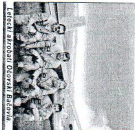
Leťaci akrobati Očovski Batovia.

Znovu v Očovej dnes ovplyvňuje najmä existencia Polnohospodárskeho družstva Očová 'ro, Fan Boh zapísal, aj v súčasnej situácii v slovenskom poľnohospodárstve tunjunge a dáva prítoku mnohým obyvateľom obce. Hoci, ako nám povedala pra-